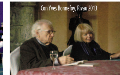
Con Yves Bonnefoy, Rivau 2013