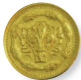
1993, "Fiorino della Città di Firenze"