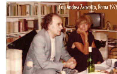
Con Andrea Zanzotto, Roma 1978