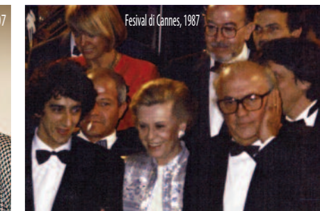
Festival di Cannes, 1987