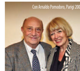
Con Arnaldo Pomodoro, Parigi 2007